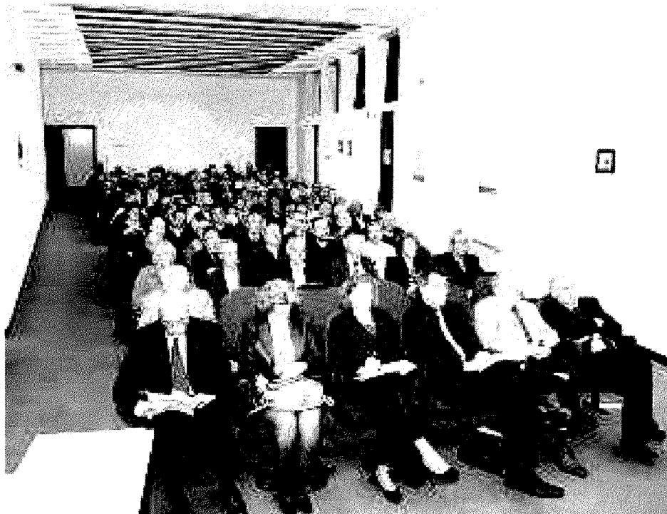
L'assemblea di ieri mattina presso l'aula magna dell'università della terza età in piazza Santa Maria Maggiore